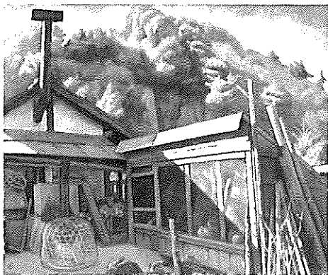
倉田白羊《山居の秋》1936年