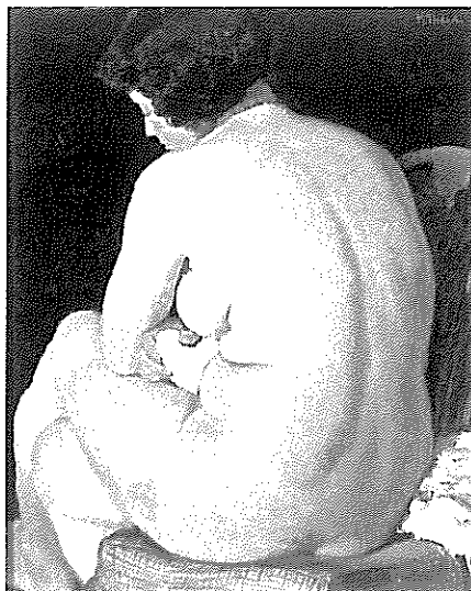
寺内萬治郎《裸婦》1954年