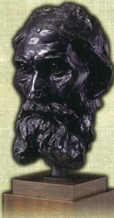
ロダン《ウスタッシュ・ド・サン＝ピエールの頭像》 1884年～1886年頃