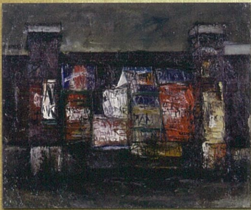
佐伯祐三《門と広告》1925年