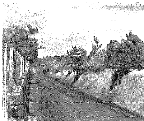
岸田劉生《路傍初夏》1920年