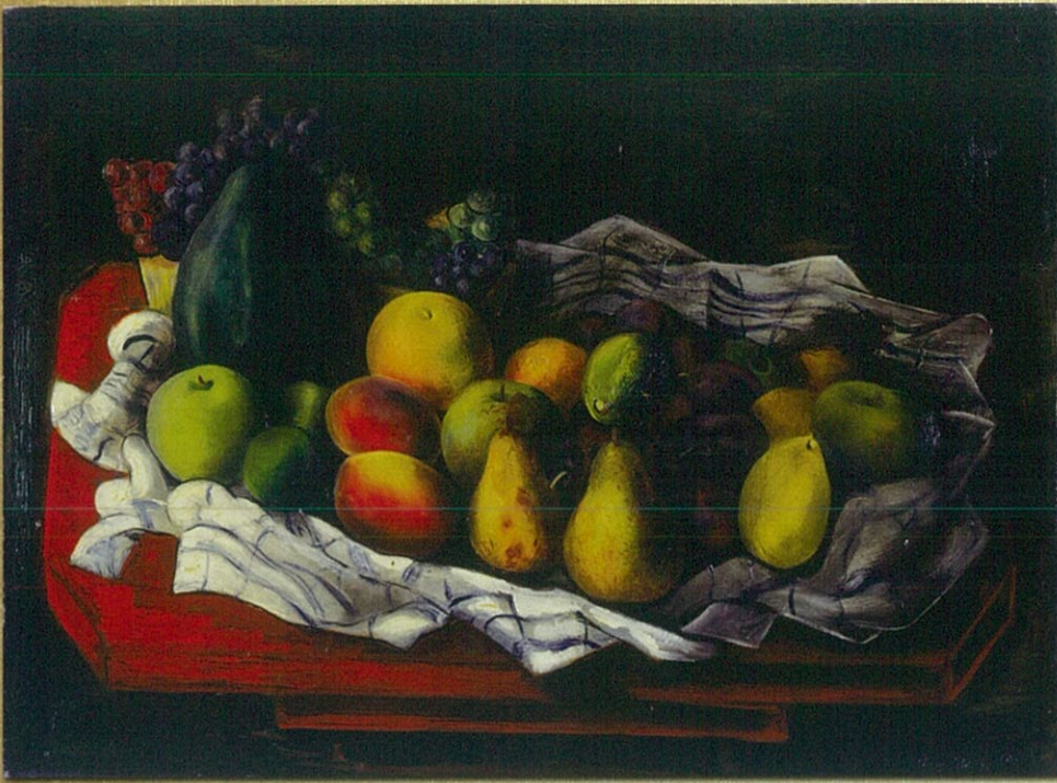
キスリング《赤いテーブルの上の果実》1944年

出品予定作家：アンドレ・ドラン／ジョルジュ・ルオー／ オーギュスト・ロダン／キスリング／岸田劉生／ 山口敏男 他