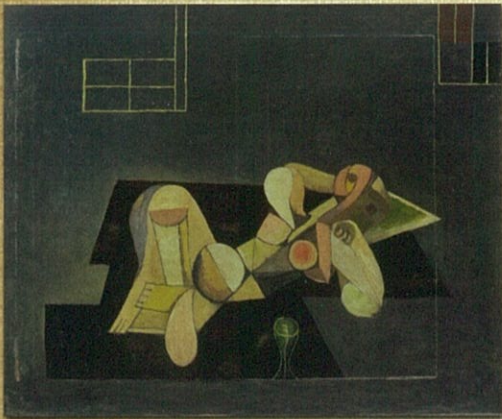
古賀春江《コンポジション》1930年頃

出品予定作家：アンドレ・ドラン／ジョルジュ・ルオー／ オーギュスト・ロダン／キスリング／岸田劉生／ 山口敏男 他