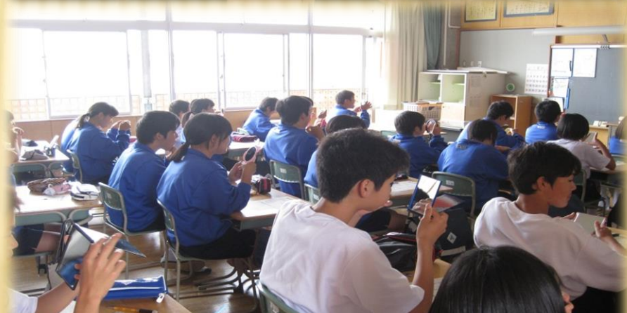
カラーテストの様子